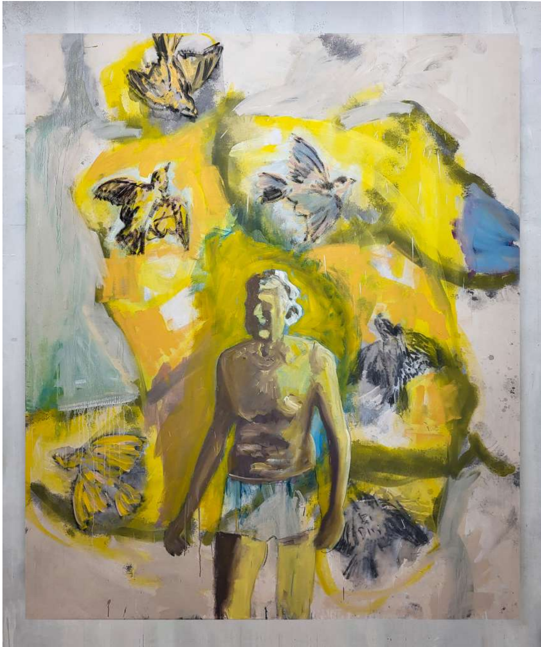
Denis Castellás Coney Island of the mind

2022 Tempera et huile sur toile 200 x 170 cm Courtesy de l'artiste et de la galerie Catherine Issert