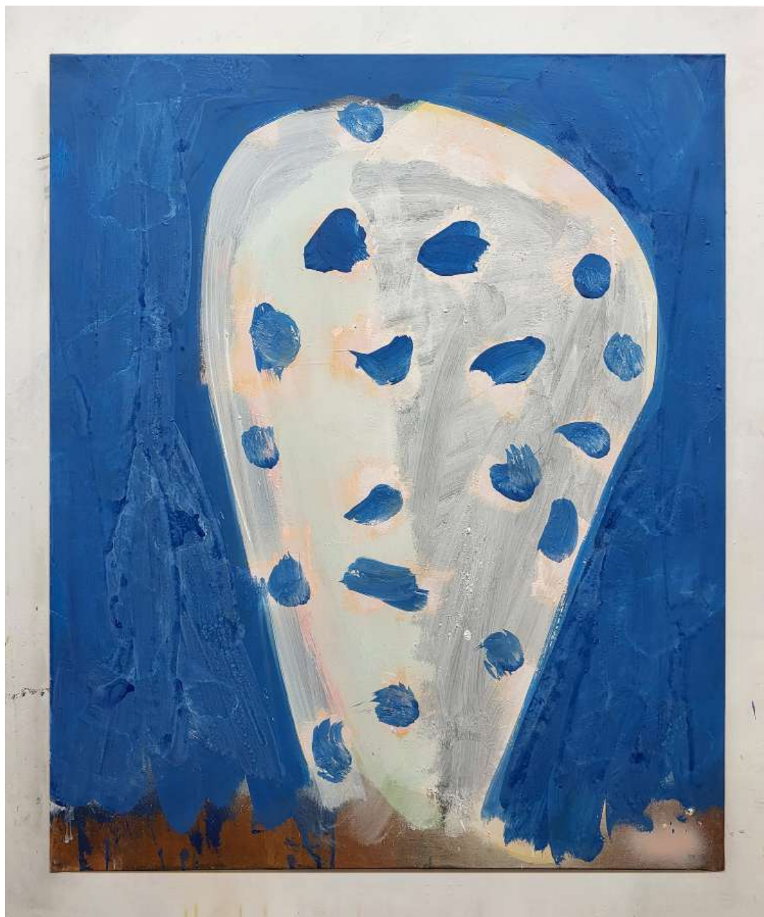
Denis Castellás Le temps qui bat