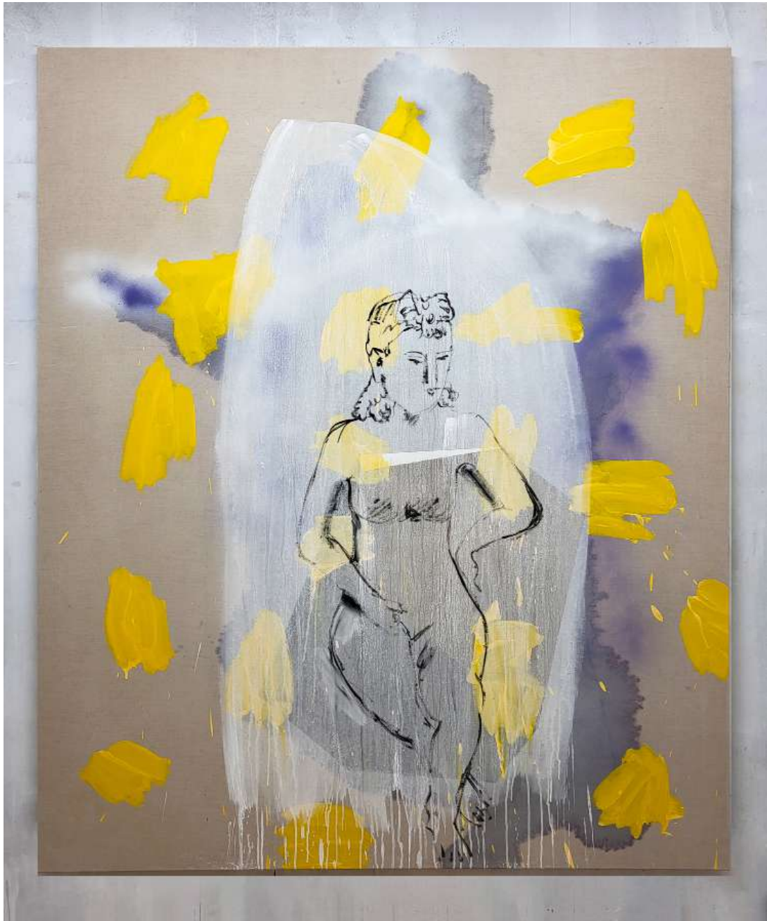
Denis Castellás Zisi's lament 2

2021 Tempera et huile sur toile 200 x 170 cm Courtesy de l'artiste et de la galerie Catherine Issert