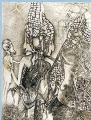
→ Fred Deux, Ombres portées , 1989, de l'album Sensation d'inachèvement , estampe gravée au burin et à la pointe sèche sur vélin blanc ©ÉD. PIERRE CHAVE.

MARINE WALLON. RELIEF , galerie Catherine Issert, 2, route des Serres, 06570 Saint-Paul, 04 93 32 96 92, www.galerie-issert.com du 29 juin au 31 août.